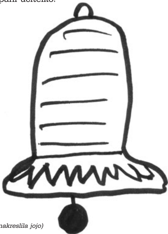
(obrázky nakreslila jojo)