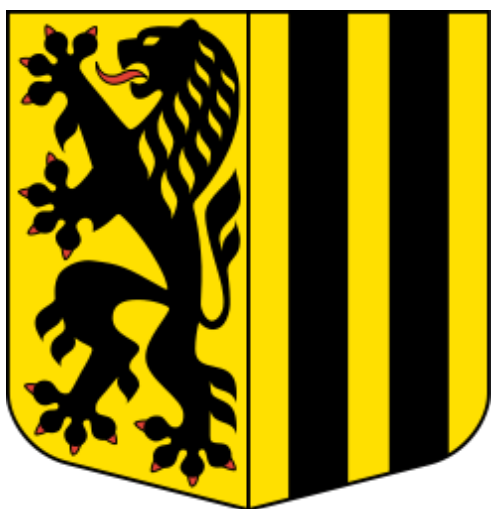
Znak Drážďan

Z adventního výletu do německých Drážďan už se pro naše žáky 2. stupně stala hezká tradice. Jako každoročně se ho zúčastnili žáci 7.–9. tříd. Mohou si tak procvičit německý jazyk, který se ve škole učí. Tentokrát se do Drážďan vydali v pátek 12. prosince. Po prohlídce drážďanských památek se věnovali příjemné činnosti, jakou je procházení se a nakupování na vánočních trzích, které patří k nejstarším a nejkrásnějším nejen v Německu. Veselé historky a zážitky z výletu za hranice všedních dní budou znít v rodičovských uších ještě hodně dlouho. A to je moc dobře.