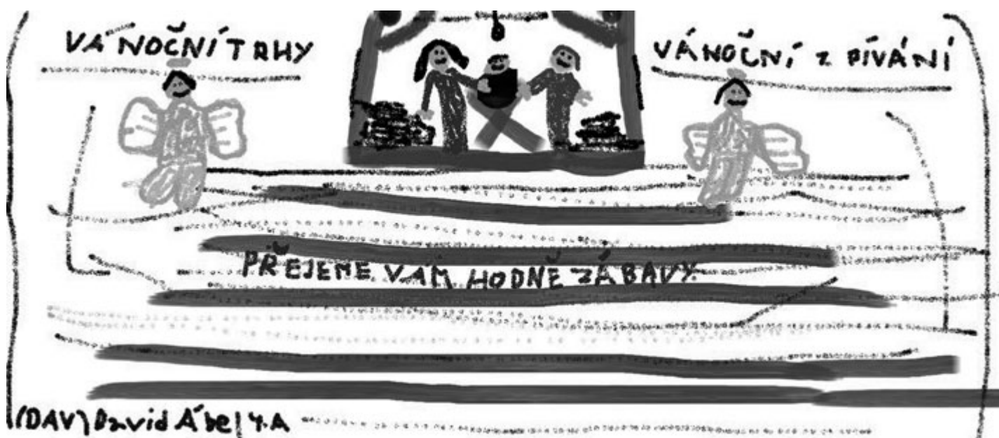
(obrázek vytvořil dav)