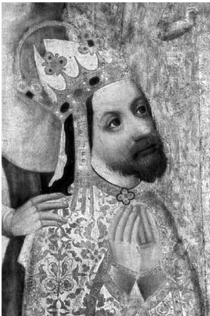
Karel IV.